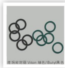
坩埚密封圈 Viton 绿色/Butyl 黑色