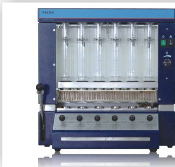
SCINO™ FT350 热浸提系统

半自动浸提系统，可方便的测定植物组织、混合饲料和食品中的粗纤维、洗涤纤维、纤维素、半纤维素、木质素和其它相关参数。