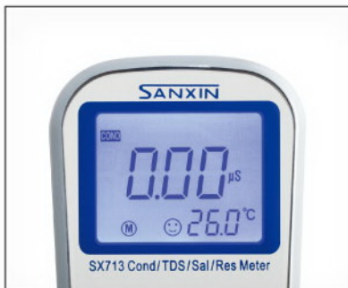
最先进的电导率测量模式