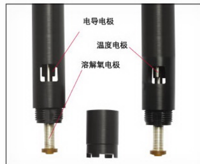
先进的溶解氧测量模式