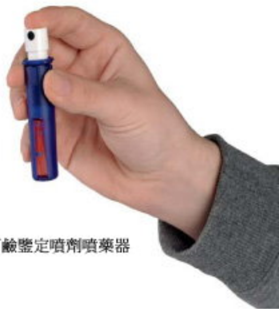
古柯鹼鑒定噴劑噴藥器