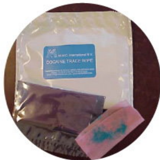
每塊尋蹤巾單獨封裝