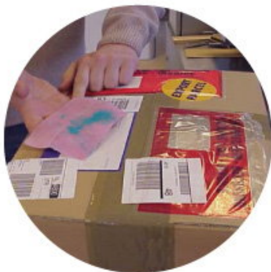
裝有古柯鹼的紙箱包裹