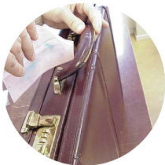
公事包上的古柯鹼