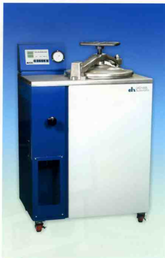
可编程 PID 数码控制器形式