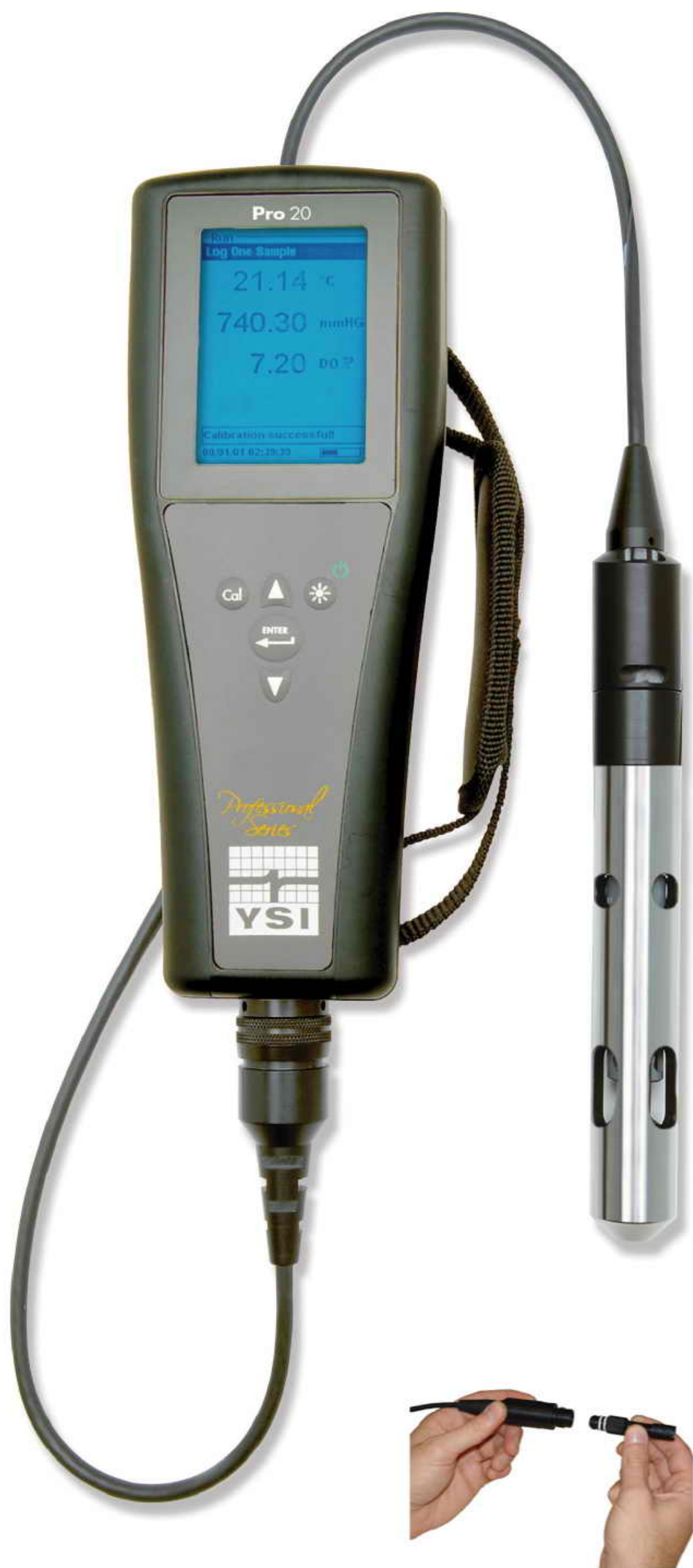
用户可自行更换传感器