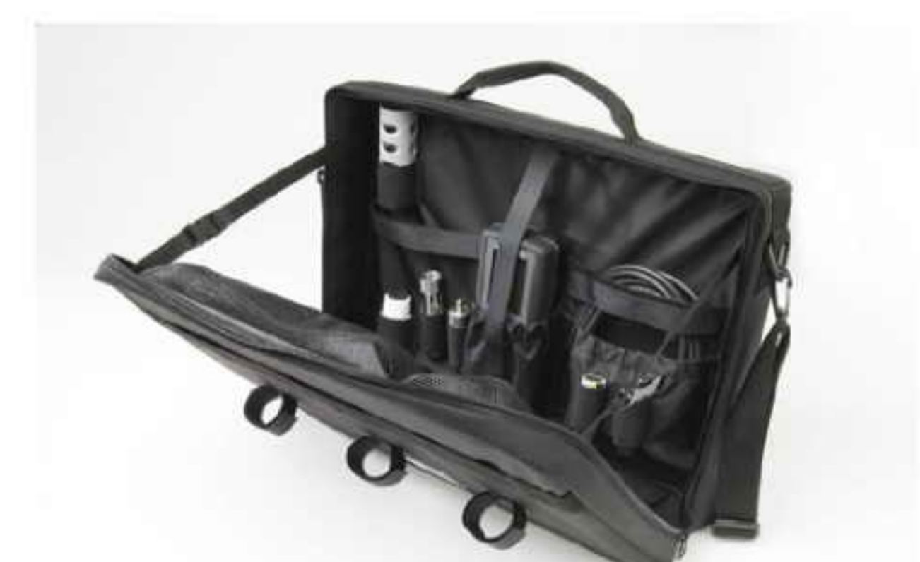
603075 软质便携包, Pro20主机、探头、电缆和附件