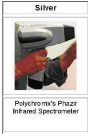
荣获2006年IBO便携式分析仪器工业设计银奖