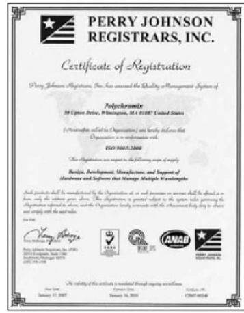
通过ISO 9001:2000质量管理体系认证