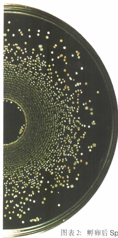
图表 2: 孵卵后 Spiral® 盘