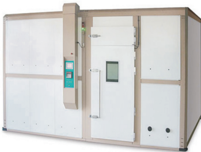
拼装式步入式试验室

宏展科技有限公司生产的步入式试验室是为了满足用户对大容积试验空间的要求而设计的，它从结构上可分为整体焊接式和拼装式。其中，仅拼装式就有三十多种尺寸规格和十六种制冷机组可以互相搭配。如果这些仍不能满足您的要求，广东宏展科技有限公司可以为您专门设计。步入式试验室可用来测试大部件、组件和整机产品，从计算机、复印机到车辆和机器，也可以作为一个试验环境来测试食品、药品的储藏寿命。