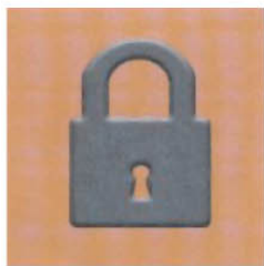
锁定功能显示： PMA.Quality的锁定功能 防止未经许可而使用