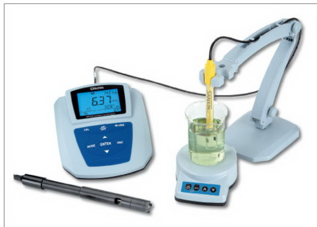
MP526型电导率/溶解氧测量仪