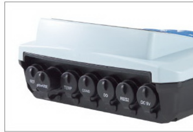
仪表符合IP54防尘防溅等级