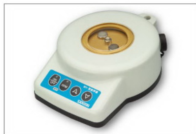
901型智能搅拌器 (可设定转速，交直流二用)