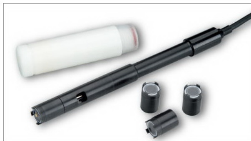
溶氧电极、校准套和隔膜帽