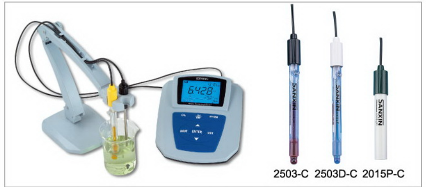
MP512-01型, MP512-02型, MP512-03型