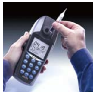
便携COD多参数水质分析仪