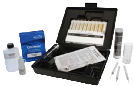
凯迈快速水质分析套件