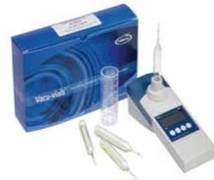
便携单参数分析仪