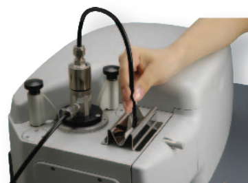
簡易乾式進樣裝置