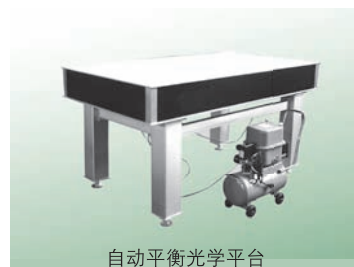
自动平衡光学平台