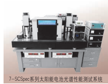
7-SCSpec系列太阳能电池光谱性能测试系统