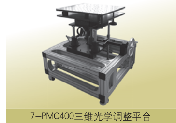
7-PMC400三维光学调整平台