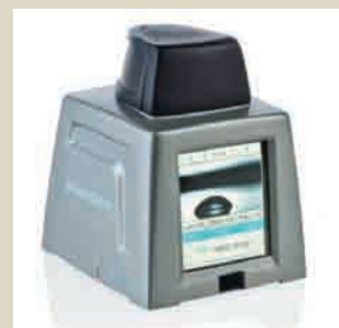
便携式接触角仪Theta QC *用于质量控制和表面快速检测*