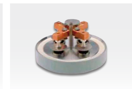
Left: EM QSG100 film thickness monitor