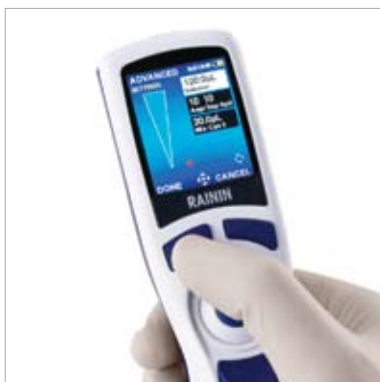
1. 设置所需移液的总量

无论您使用什么应用，E4 XLS都可轻松、快速地编程和设置。如下步骤显示如何容易地设定系列稀释，该模式通常用于qPCR、ELISA及许多细胞检测中：