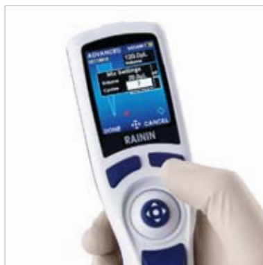
2. 设定混合量程和混合循环的 次数