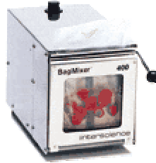
BagMixer® 400W 应用范围 食品微生物分析：生肉、熟肉、鱼、蔬菜、水果、饼干等；药品和化妆品微生物分析、烟草等稀释和混合。。。等等。