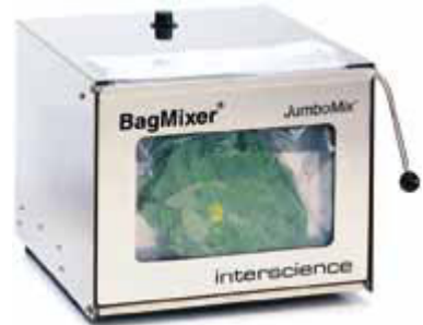
BagMixer® 3500W "JumboMix®" 应用范围 大量样品处理，包括食品、猪毛虫测定、纺织品、细菌和化学测试、废弃物、空气和水过滤、土壤、无菌测试、法医学测试、粉末和聚合物工业混合等等