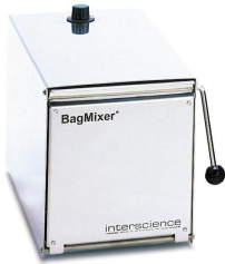
BagMixer® P (不锈钢门) 100 , 400或3500