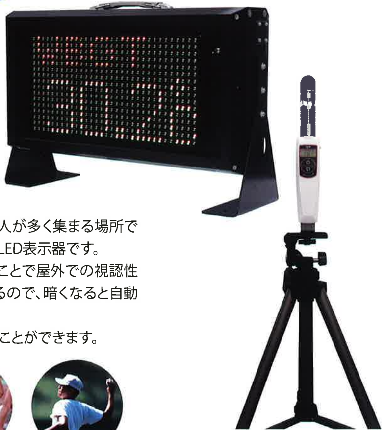
※熱中症指標計本体は別売です。

スポーツ施設や学校、建設・道路工事現場などの人が多く集まる場所でのWBGTモニタリングに最適な防水仕様の高輝度LED表示器です。