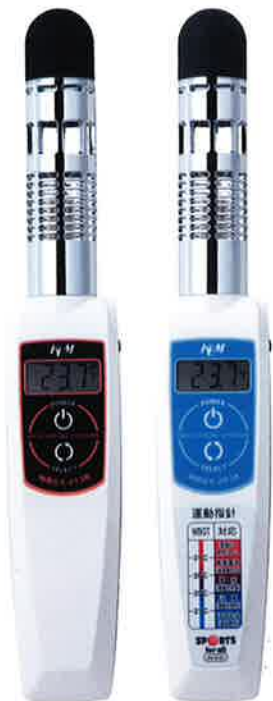
made in Japan