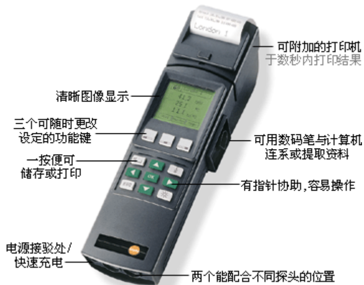
探头一览 - testo 650 参比级水分活度测定仪