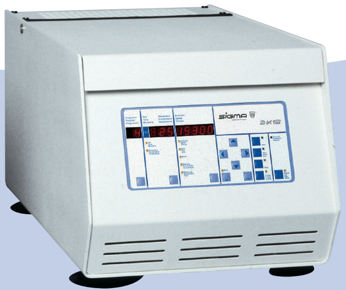
Tischkühlzentrifuge Refrigerated Centrifuge