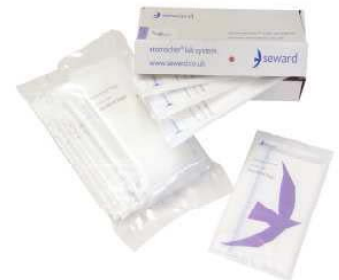
硬纸箱和塑料便携包装