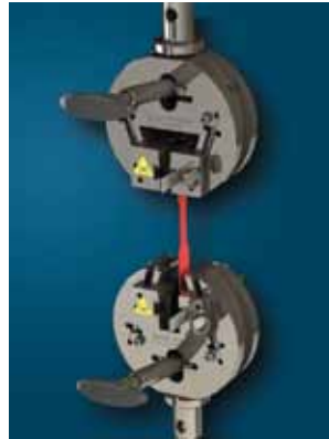
金属和塑料拉伸夹具