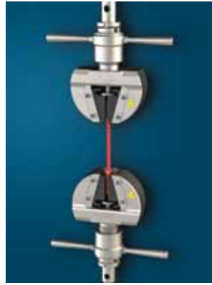
金属和塑料拉伸夹具