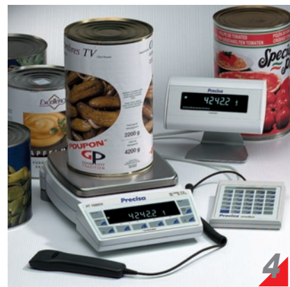
鍍鉻鋼質外型秤盤，抗污防蝕、經久耐用

* 紅黃綠品管指示燈、條碼掃描器、第二顯示幕、SmartBox控制盒，均為選購配件