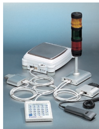
條碼掃描器、多功能控制盒、 品管指示燈、串接盒，擴充性強