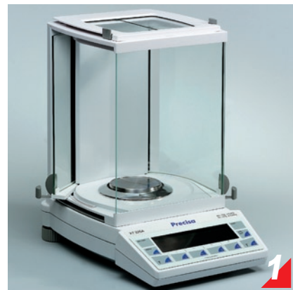
0.0001g機種，配備抗靜電玻璃防風罩