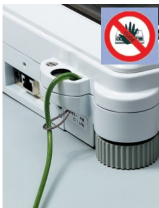
機體防盜扣環及密碼鎖，可防止 天平失竊、或被任意更改設定值