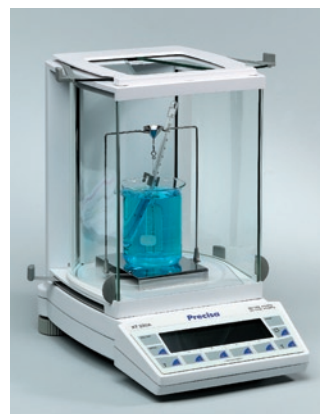
內建「固 / 液體比重」測量程式 (固 / 液體比重吊掛裝置需另購)