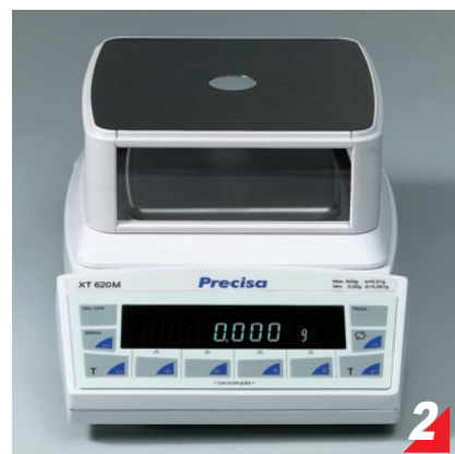
上開式玻璃防風罩，操作方便，避免誤差