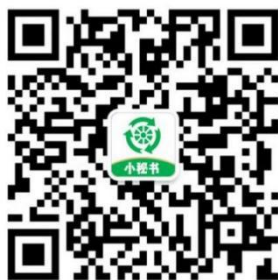
【竞赛报名与组队咨询】

执委会秘书处【格林梅德(北京)科技有限公司】：010-62976096/13488674857