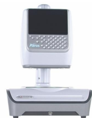
Aeros 反射型分光光度计