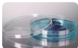
微生物、组织细胞培养