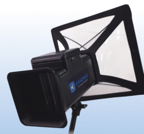
风量罩 MODEL 6750

注: 如遇产品设计、规格、参数变更, 均以我公司提供的最新数据为准, 恕不另行通知。