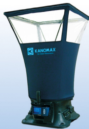
风量罩 MODEL 6710