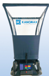
风量罩 MODEL 6720