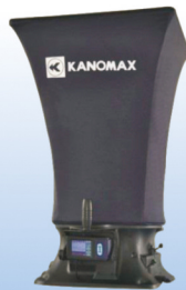
风量罩 MODEL 6705