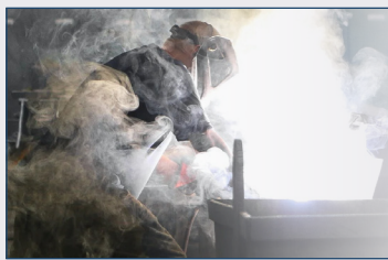
工作场所有毒有害气体