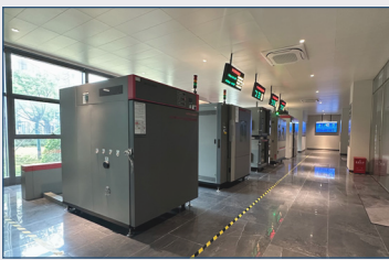
环境测试舱气体采样

应用于实验室气体释放舱，室内环境，公共卫生，职业卫生、等场景中气态污染物的采样检测，连接固体吸附剂管，气泡吸收管，滤料采样夹等采样介质收集空气中的气体、粉尘、颗粒物等，以检测有毒有害物质。