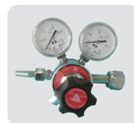
专用 CO 2 减压阀