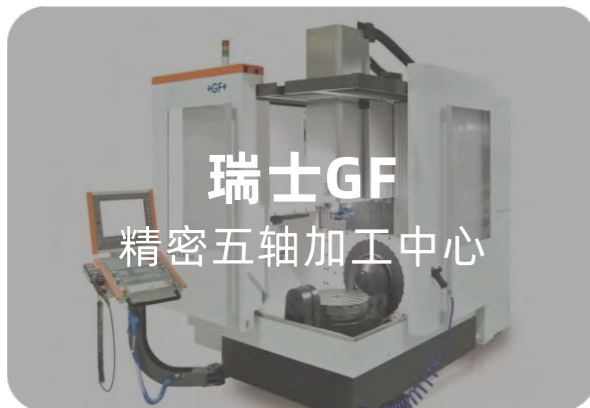
瑞士GF 精密五轴加工中心

公司设有数控精密加工车间，配备进口德玛吉（DMG）数控车削中心、米克朗（MIKRON）五轴加工中心和高速立式加工中心、马扎克（MAZAK）立式加工中心，核心关键精密零部件完全自主加工，有效保证零部件尺寸精度和形位公差，确保系统总成和仪器装配一致性和性能稳定性。