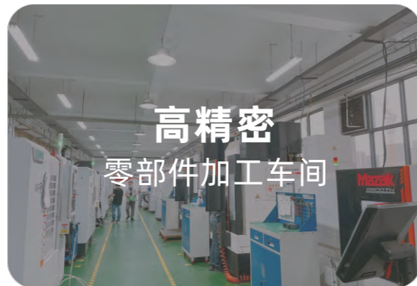
高精密 零部件加工车间