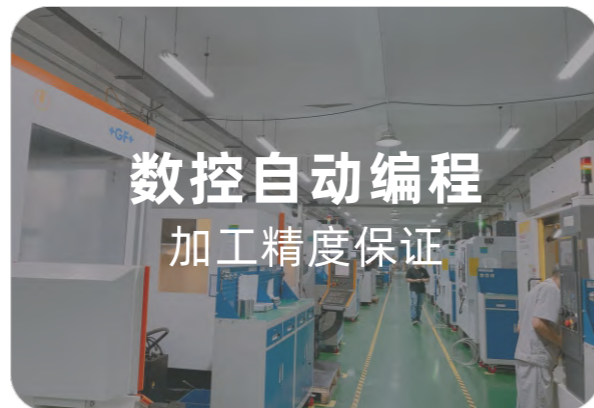
数控自动编程 加工精度保证