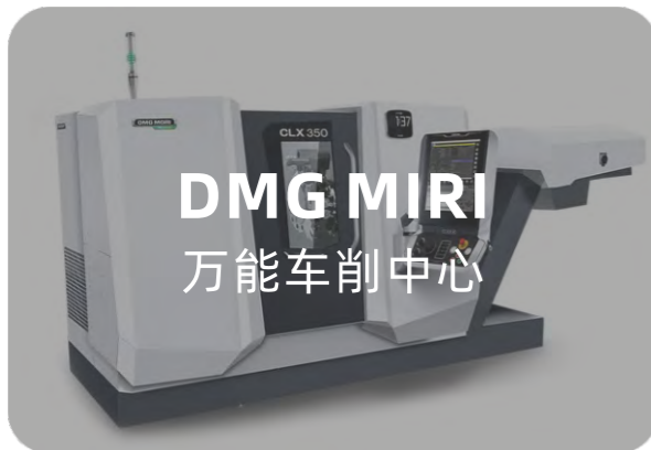
DMG MIRI 万能车削中心