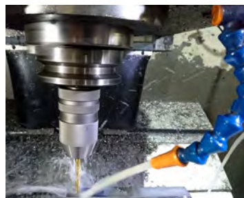
水溶性润滑剂的 浓度管理