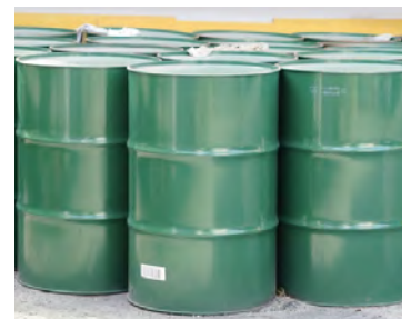
甲醇等废液的 浓度管理