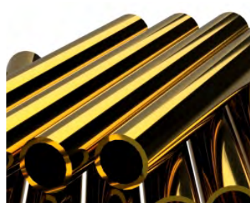
电镀液中的 浓度管理