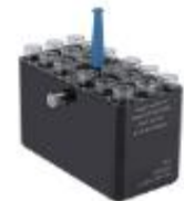
5008水平挂篮 3/5/7ml×72孔 4000rpm/3040×g