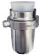
5002水平挂篮 100ml×4孔 5000rpm/4600×g