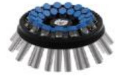
5013角式转头 15ml×30孔 5000rpm/4100×g