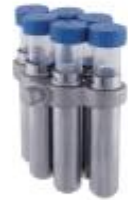
5004水平挂篮 10/15ml×24孔 4000rpm/3040×g