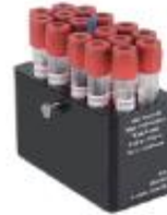
5007水平挂篮 5ml×64孔 4000rpm/3040×g