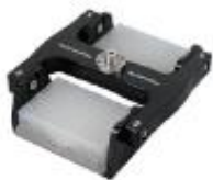
5010酶标板转头 微孔板4块×2×96孔 深孔板2块×2×96孔 4000rpm/2470×g