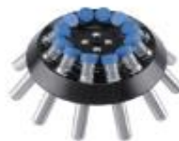
5011角式转头 15ml×12孔 6000rpm/5150×g