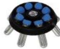
5012角式转头 50ml×8孔 6000rpm/5150×g