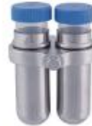
5003水平挂篮 50ml×8孔 4000rpm/3040×g