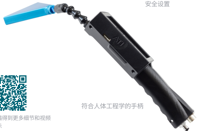
符合人体工程学的手柄