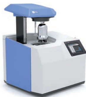
C 6000 氧弹量热仪 订货号 0008804300

如您需要，在控温上使用 Oven 125 基本型和控制型的同时还可有如下 IKA 仪器供您实验室选择。