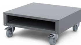
移动底箱 方便移动使用 订货号 0020007602