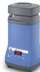
A 10 基本型 批次式研磨机 订货号 0004020700