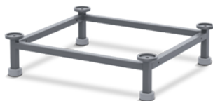
叠加架 叠加多个烘箱 订货号 0035001326