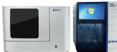
OL2010/OL2020/OL2030 OL2010N/OL2020N/OL2030N 全自动阴离子表面活性剂分析仪 全自动挥发酚分析仪 全自动阴离子表面活性剂及挥发酚分析仪