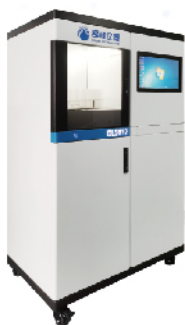
OL5010/OL5011/OL5012 全自动总磷总氮分析仪