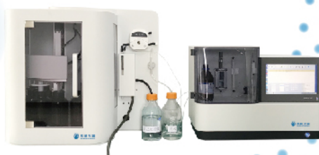
OL1020/OL1040/OL1043 全自动红外/紫外/荧光测油仪