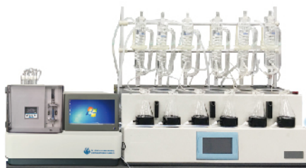
OL2050 全自动亚硝酸盐分析仪