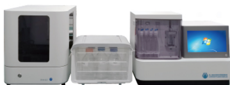
OL2060 全自动氨氮分析仪