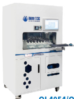
OL4054/OL4108 全自动BOD 5 智能分析仪