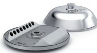
G-L 转子 2 \times PRC 8 联管 \times 0.2 ml 订货号 0030001345