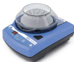
mini G 离心机 订货号 003958025