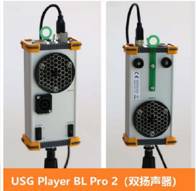
USG Player BL Pro 2 (双扬声器)

超声波播放装置 UltraSoundGate Player BL Pro 技术参数：