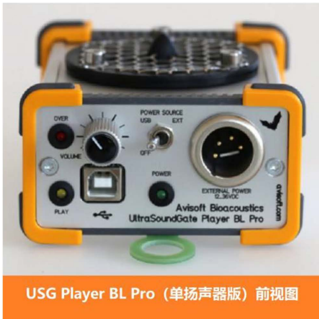
USG Player BL Pro (单扬声器版) 前视图

UltraSoundGate Player BL Pro 是一款功能齐全的超声波播放装置，用于引诱蝙蝠。该系统由 USB 计算机接口、D/A 转换器、功率放大器、扬声器、三脚架和播放软件组成。该装置可以完全通过计算机的 USB 接口（总线供电）或外部 24...36 V 电池供电，以产生可能的声级。它可配备单个扬声器 (#70115) 或两个集成扬声器 (#70116)。双扬声器版本当然适合引诱蝙蝠进入雾网。可连接的眼睛允许将装置挂在雾网杆或树上。随附的 RECORDER USGH 软件的舒适播放列表功能允许以随机顺序和随机间隔播放原始、降噪或完全合成的蝙蝠呼叫。可以联系我们找到越来越多适合此目的的欧洲蝙蝠声音。