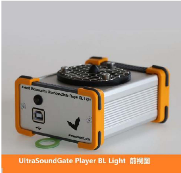
UltraSoundGate Player BL Light 前视图