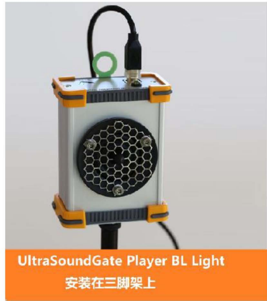
UltraSoundGate Player BL Light 安装在三脚架上