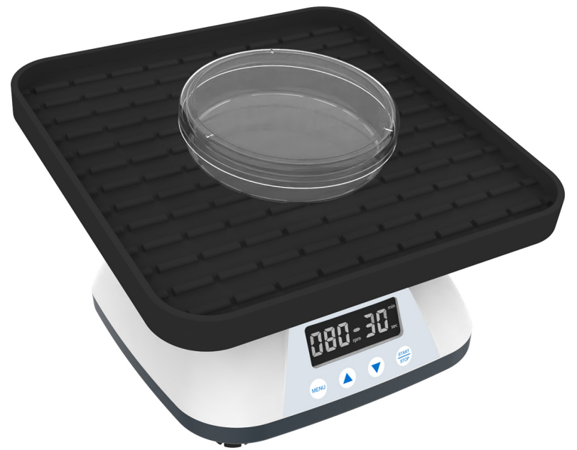
SKW-Pro 三维摇床 使用说明书

公司：上海亚霖科技有限公司 地址：上海市嘉定区外冈镇银龙路258弄金地威新智造园20号楼5楼 网址：www.first17.cn 座机：021-59906008