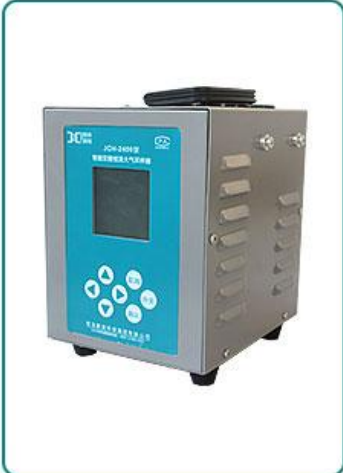
主机 1 台