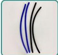
硅胶软管 4 根