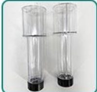
干燥筒 2 个