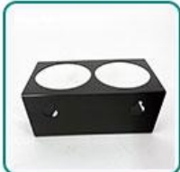
挂架 1 个