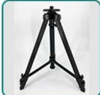
三脚架 1 副