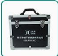
铝合金箱 1 个