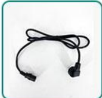
充电器 1 套