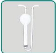
U形多孔玻板 吸收管