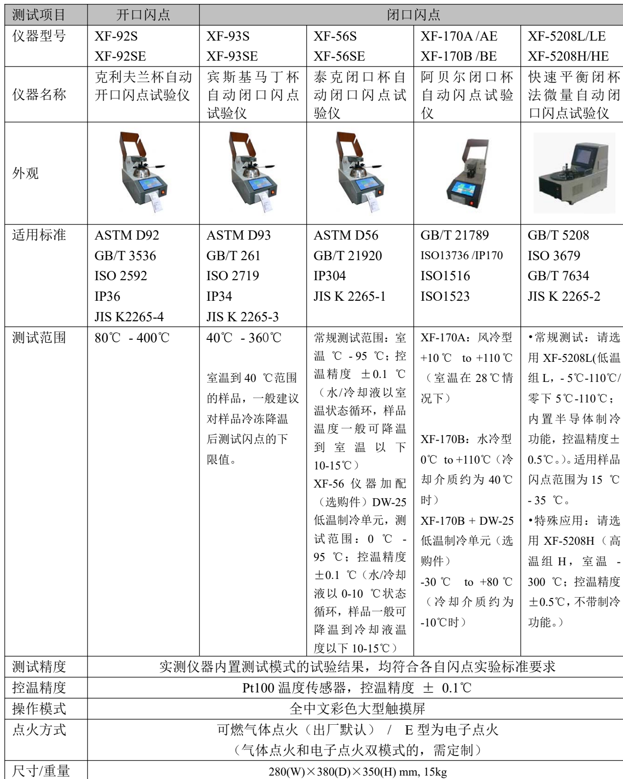
自动闪点仪比较表