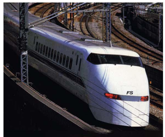
... 电力应用会产生电场