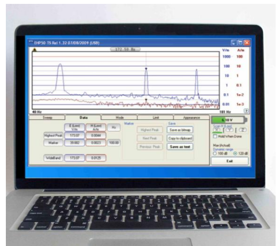
使用 PC 软件 EHP50-TS 进行控制测量