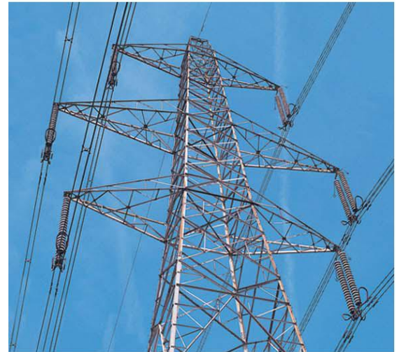
... 电力传输会产生电场