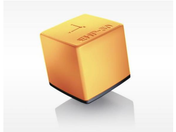
紧凑型的 EHP-50F 包含了电磁场的所有测量技术

基于 ICNIRP 2010 和 IEC 61786-2 标准要求，EHP-50F 采用了时域卷积的计权峰值评估方式。测量范围覆盖 1 Hz - 400 kHz，并可以给出测量结果随时间变化的曲线图。