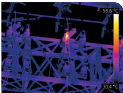
过热变电站断路器