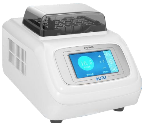
HICE-4 4 度电子冰盒

上海沪析实业有限公司 SHANGHAI HUXI INDUSTRIAL CO.,LTD.