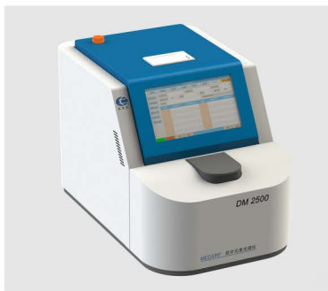
DM2500 型 MMEDXRF 轻中元素光谱仪