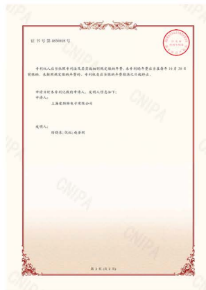
X 荧光多元素分析仪发明专利证书