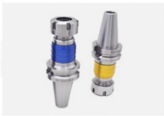
BT30柔性伸缩攻牙刀柄