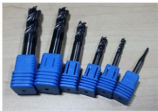
6件套进口硬质合金铣刀