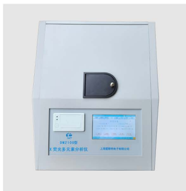
DM 2100 型 X 荧光多元素分析仪