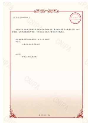
X 荧光多元素分析仪发明专利证书