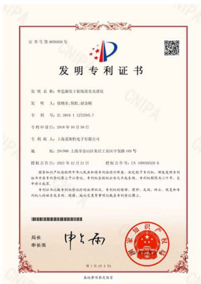
单色激发能量色散 X 射线荧光 (MEDXRF) 光谱仪发明专利证书